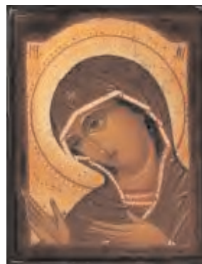
Icone de la vierge en motion

Une oeuvre sensible qui tient bien dans la bible