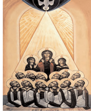
Icône de la pentecôte

Ces livrets ne sont pas des enseignements complets sur les charismes mais plutôt un support de partage en communauté