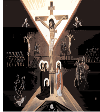
Icône de la crucifixion

Ces livrets ne sont pas des enseignements complets sur les charismes mais plutôt un support de partage en communauté