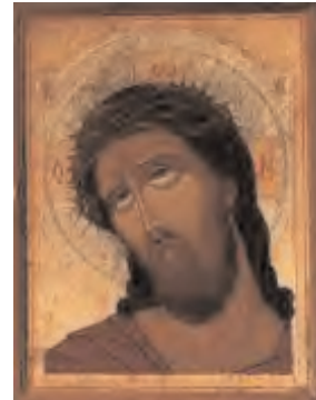
Icone du Christ Souffrant

Ces livrets ne sont pas des enseignements complets sur les charismes mais plutôt un support de partage en communauté