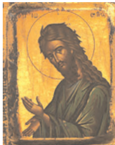
Icone de Jean-Baptiste

Ces livrets ne sont pas des enseignements complets sur les charismes mais plutôt un support de partage en communauté